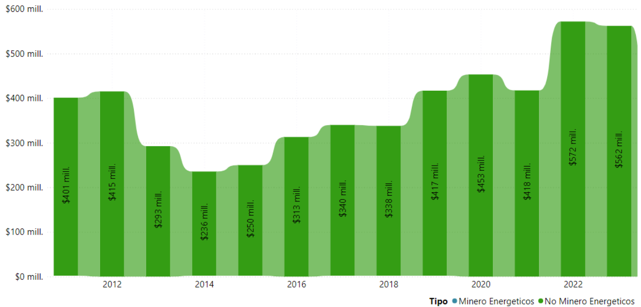
Gráfico 2. Evolución de las exportaciones del Valle del Cauca Hacia Estados Unidos, 2011-2023

Fuente: DIAN | Datos procesados por Amcham Sur Occidente